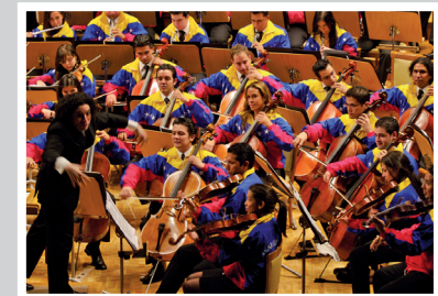
Musik schafft neue Perspektiven Music providing new perspectives